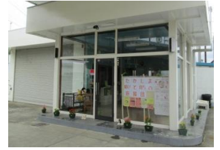
たかしま結びと育ちの応援団事務所

※結びと育ちのコンシェルジュ（利用者支援専門員）が、結婚・妊娠・出産・育児について、一緒に考え、情報提供や関係機関につなぐなどのお手伝いをします。 身近な相談窓口として、お気軽にご利用ください。