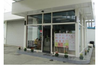
たかしま結びと育ちの応援団事務所