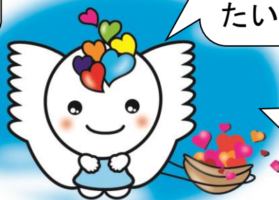
たかしま結びと育ちの応援団 キャラクター

たかしま結びと育ちの応援団の事業は、平成27年度に高島市より委託を受けたNPO法人元気な仲間が実施しています。