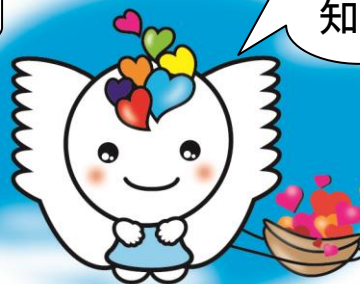
たかしま結びと育ちの応援団 キャラクター