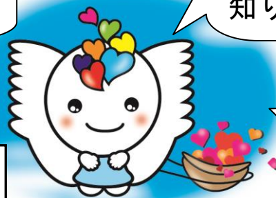
たかしま結びと育ちの応援団 キャラクター

たかしま結びと育ちの応援団の事業は、平成27年度に高島市より委託を受けた特定非営利活動法人元気な仲間が実施しています。