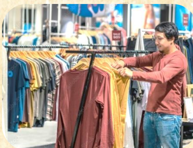
「魅力発見塾」で一緒に洋服選び