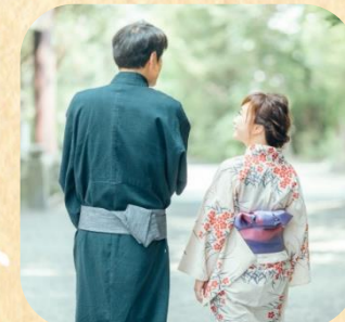
「浴衣を着る会」などを企画・実施