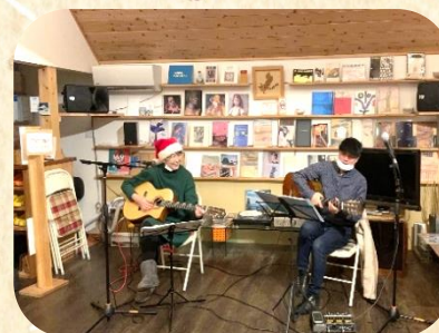
クリスマスイベントで演奏を披露