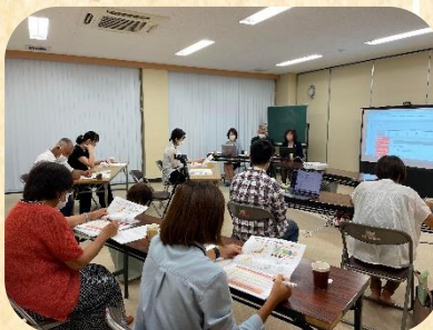
サポーター研修会