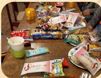
「社会人サークル」でおしゃべり