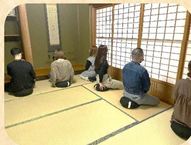
他団体のイベントに協力参加