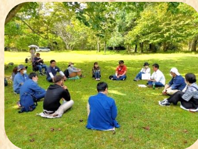
「森で哲学対話」を一緒に体験